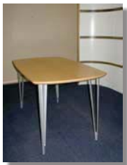
Bord 80x140 cm