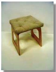
Pall med dyna