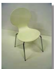
Caféstol (vit, lönn)