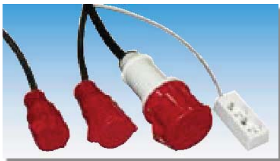
Eluttag 10A, 230V