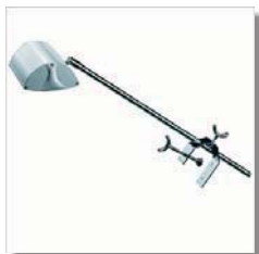
Spotlight på arm 100W